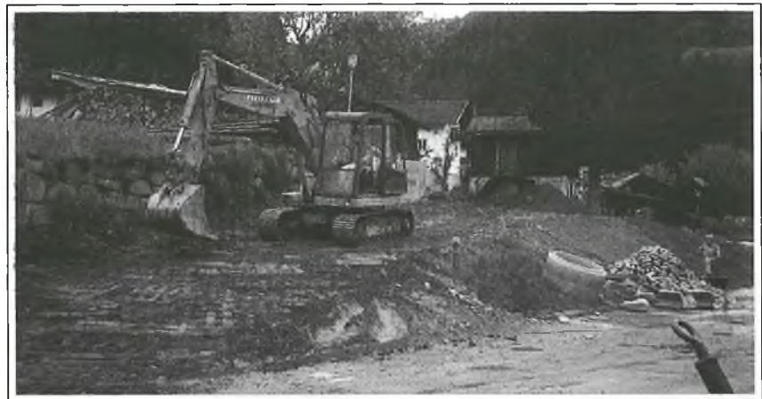
Erweiterungszone Marche, St. Peter: Erschließungsarbeiten in vollem Gang

Zahlung von ordentlichen Ausgaben Lire 52.051.141.-