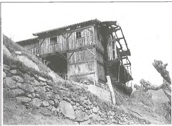
Das abgebrannte "Krapfer" Futterhaus in Steinhaus