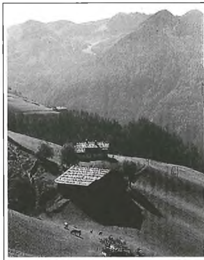
Der Erbhof "Feichter" (Feuchte) am Herrenberg oberhalb Lutlach

n Hosnsack koan Kraizer drin, Koa gscheidis Liacht und wianig Loahn, koa Rente und ah Urlaub koan. Mit Fleiß und Sparsinn, Gottvertrau'n, tuet sie af Kind und Kranke schau'n, sie hat die Eltern hoach in Ehr'n und alle Nachbarn habm sie gern.