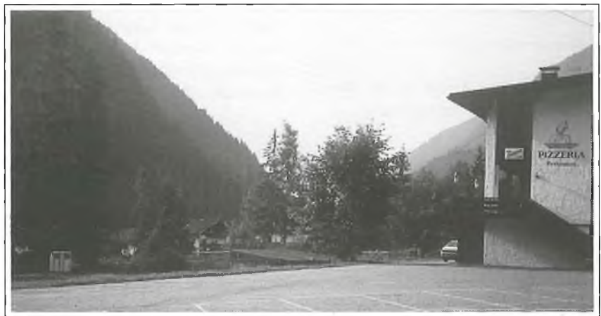
Sport- und Freizeitzone Luttach: Jetzt wird's ernst: Fa. F. Oberschmied aus St. Johann hat den Zuschlag für das 1. Baulos erhalten.

Malerarbeiten an den Grundschulen - Zahlung der Rechnung Fa. Rauchenbichler: Lire 2.808.400.-